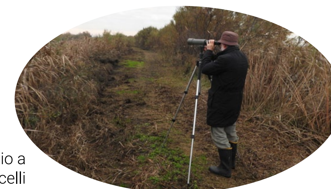
Monitoraggio a vista degli uccelli