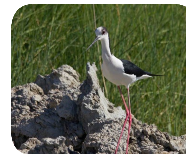
cavaliere d'Italia ( Himantopus himantopus )