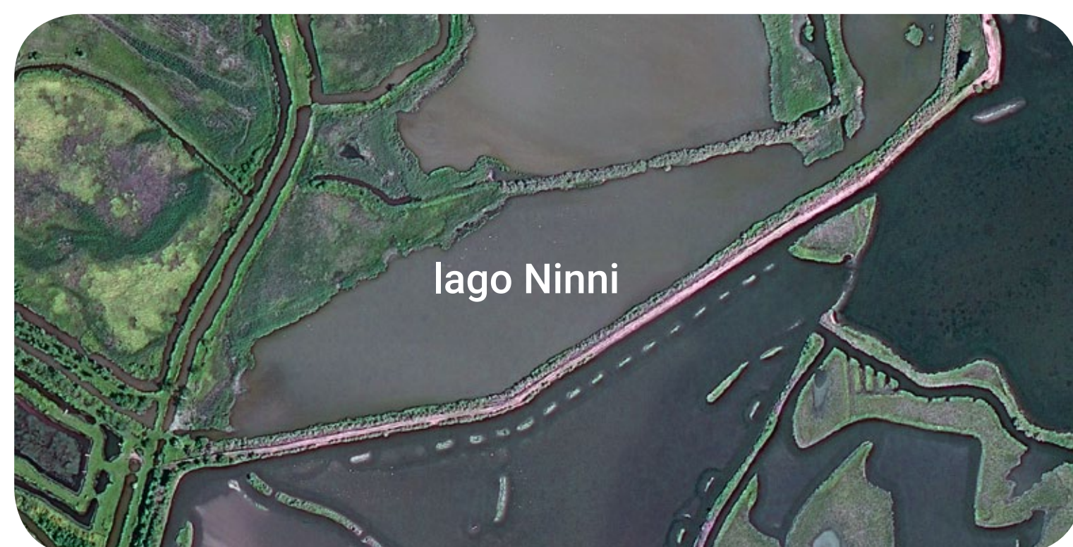
Veduta del lago Ninni da una riprea aerofotogrammetrica

Il Lago Ninni è lo specchio acqueo più a sud dell'Oasi WWF di Valle Averte e si estende per circa 5 ha. E' un'area di massima tutela dove viene limitato il disturbo antropico.