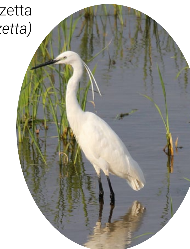
garzetta ( Egretta garzetta )