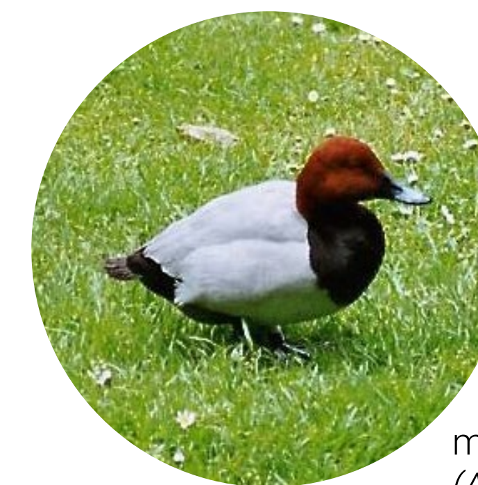
moriglione ( Aythya ferina )

Questo lago di valle porta il nome del conte Alessandro Pericle Ninni (1837-1892) famoso naturalista veneziano e studioso di folklore, linguistica ed etnografia.