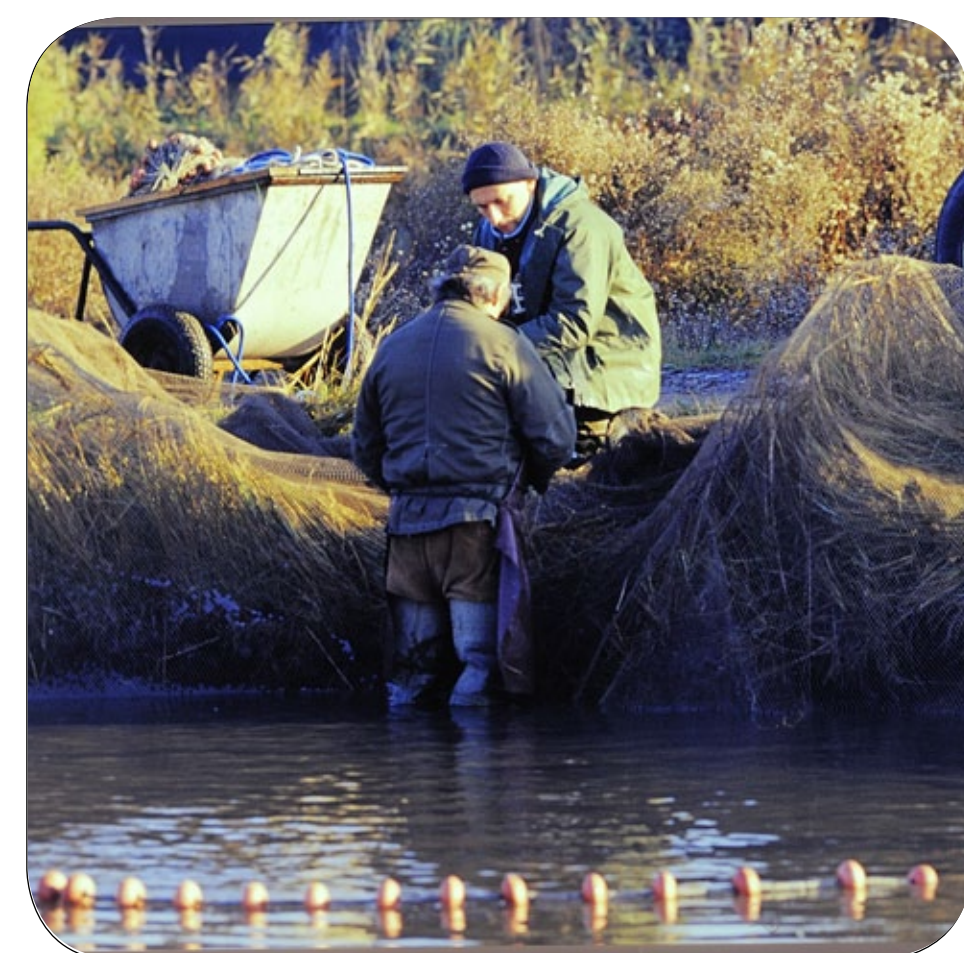
La pesca in valle