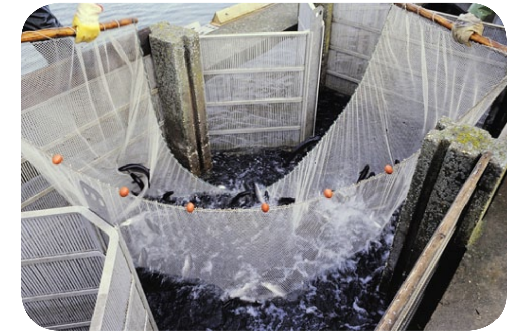
Pesca delle orate in valle

Le azioni previste dal progetto LIFE FORESTALL contribuiranno a migliorare l'efficienza idraulica di questa antica valle da pesca.